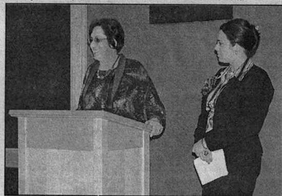
Prelegentki – matka i córka – mówią o wspólnie napisanej książce.

Mówiła o powstaniach 1830 i 1863 roku, próbach pozbawienia Polaków mieszkających pod zaborami ich narodowej tożsamości i o roli Kościoła katolickiego w powstrzy-